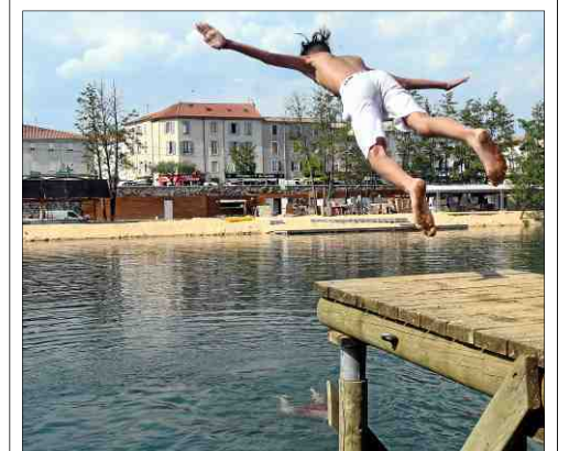
■ Un pic de chaleur qui risque de durer. A.B.