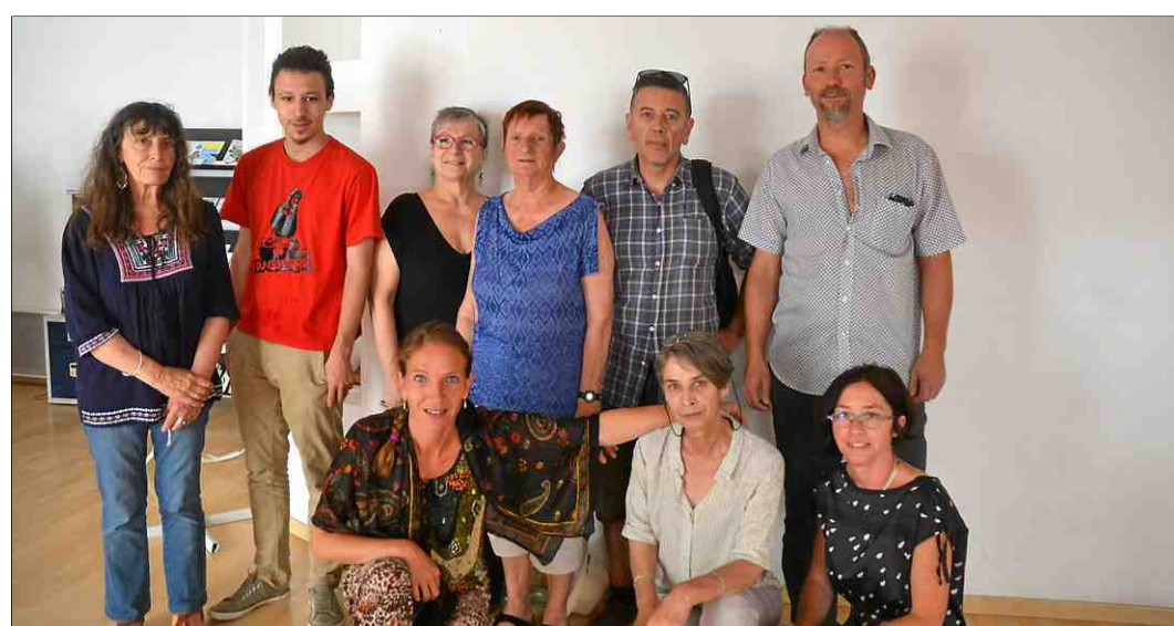
■ Une partie du nouveau conseil d'administration de la MCC qui tenait son AG ce samedi.

À la rentrée, elle va même élargir son offre en proposant des cours de chant individuels, du piano pour les enfants, du théâtre pour les collégiens et lycéens, une aide aux populations hispaniques pour les démarches administratives et des cours de FLE