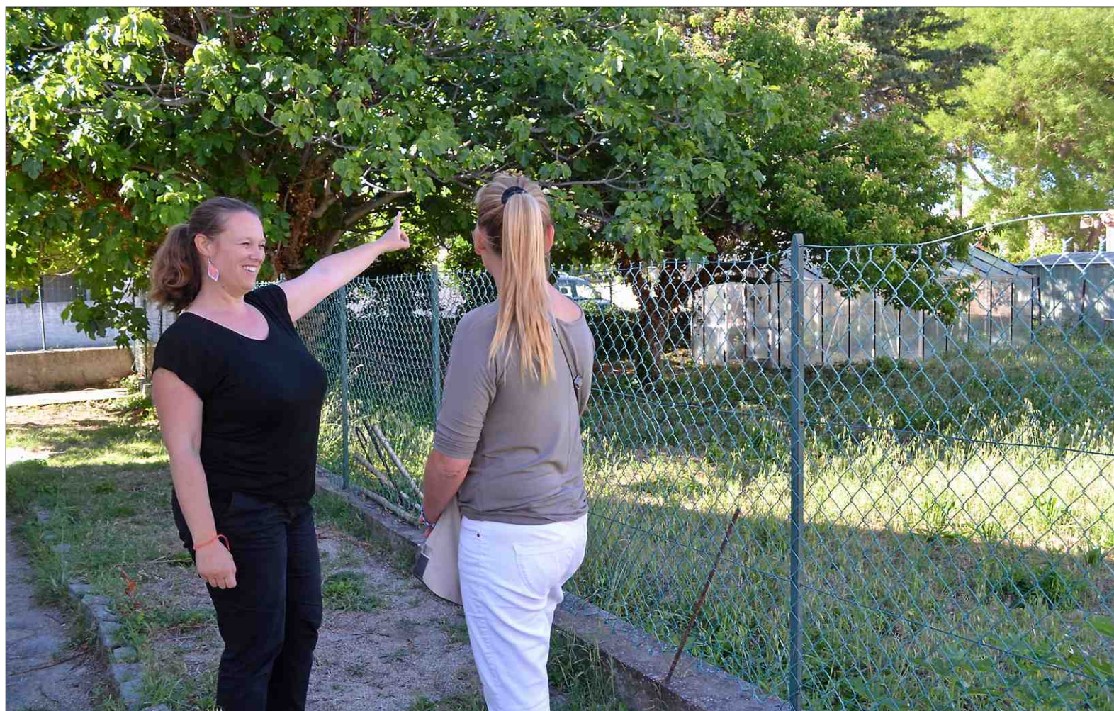
■ Deux enseignants ont quitté l'Éducation nationale pour lancer leur association et, dès la rentrée, un projet scolaire innovant.